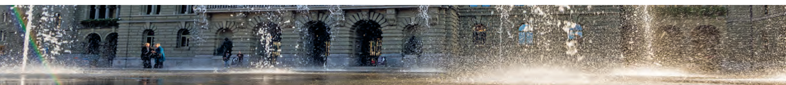
Seit 2004 erfreut das Wasserspiel auf dem Bundesplatz Bern sowohl Einheimische als auch Auswärtige.

Über die beiden OdA ist die NVS indirekt im Dachverband Komplementärmedizin, dem Dakomed vertreten, wobei der Autor dieses Artikels dort für die OdA KT im Vorstand Einsitz hat. Als Gönnermitglied des Dakomed nimmt die NVS auch an dessen Mitgliederversammlungen teil, meldet dort ihre Bedürfnisse an, und die NVS Vorstandsmitglieder lernen eidgenössische Parlamentarierinnen und Vertreter anderer Organisationen aus dem ganzen Gesundheitswesen kennen.