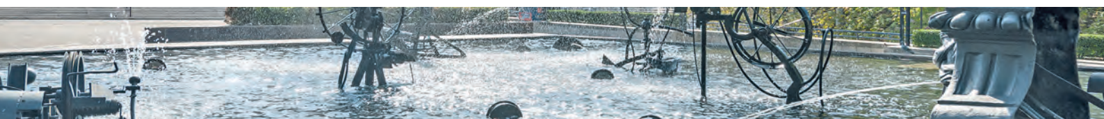
Der Fasnachts-Brunnen von Jean Tinguely in Basel erfreut Gross und Klein mit seinen Wasserspielen.