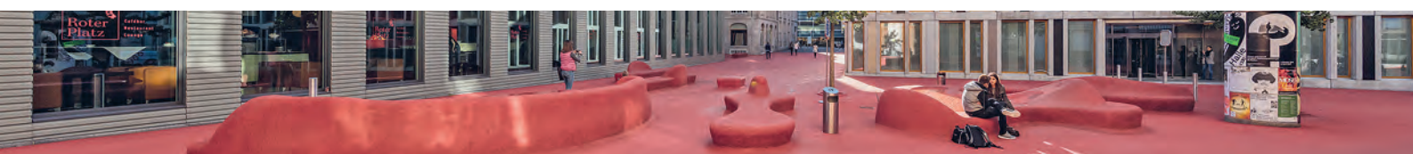
Der «Rote Platz» in St. Gallen – die Stadtlounge der Künstlerin Pipilotti Rist und des Architekten Carlos Martinez lädt zum Verweilen ein.